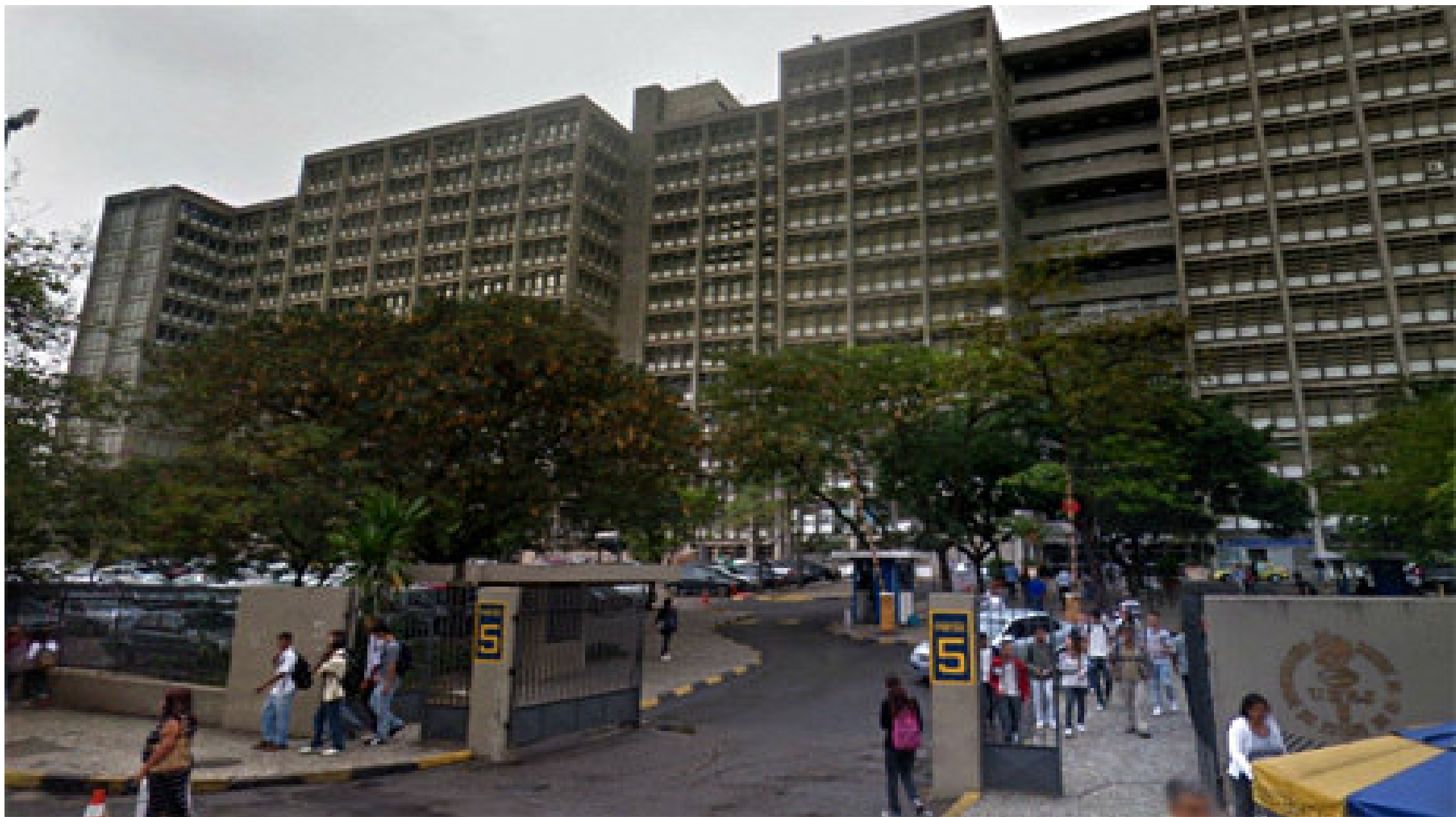
IV CONGRESO INTERNACIONAL DEL GIEI EDUCACIÓN E INCLUSIÓN: UN COMPROMISO GLOBAL Bogotá D.C. – Colombia, Octubre 3,4 y 5 de 2018